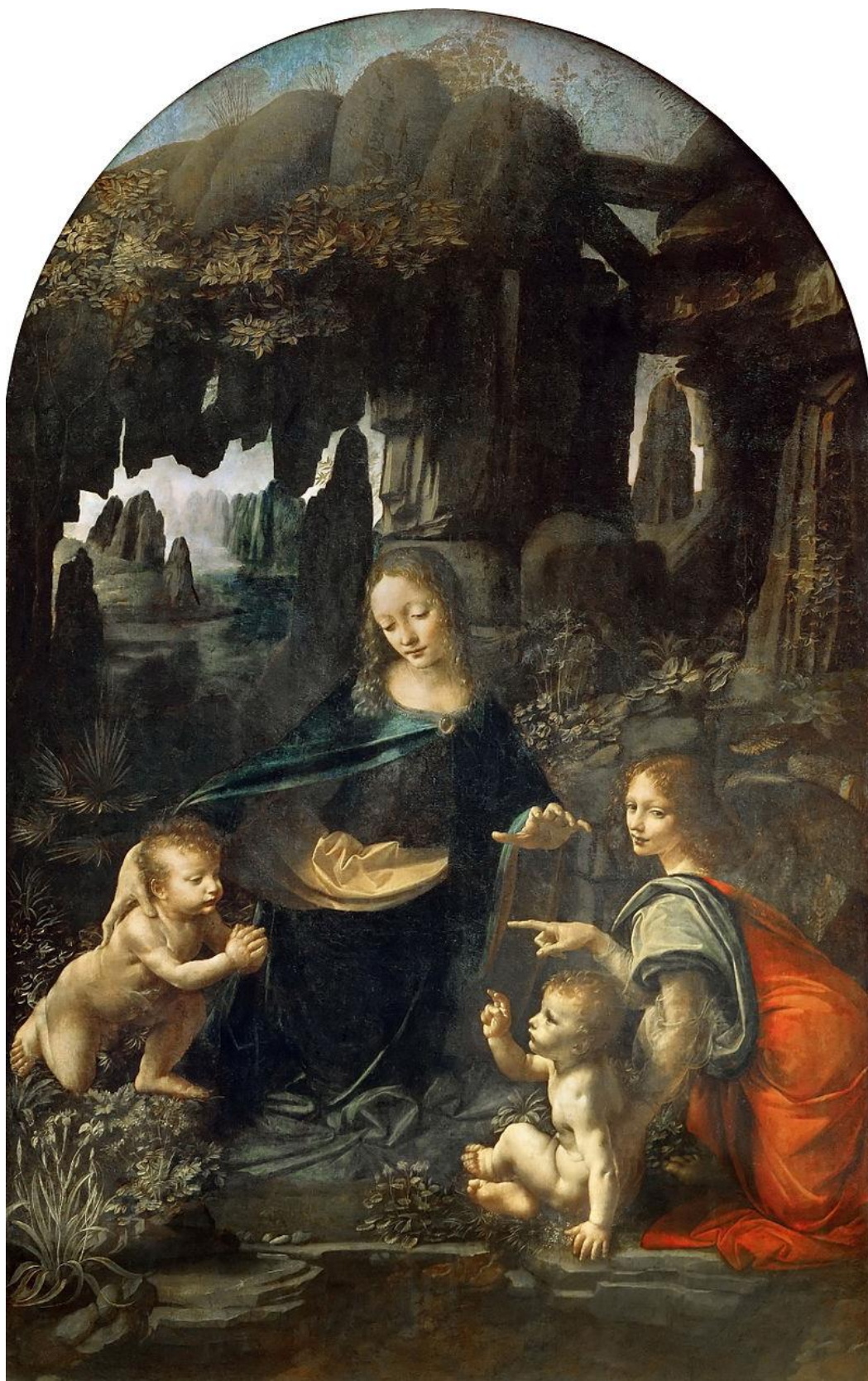
Леонардо да Винчи. Мадонна в скалах. 1483-1486.