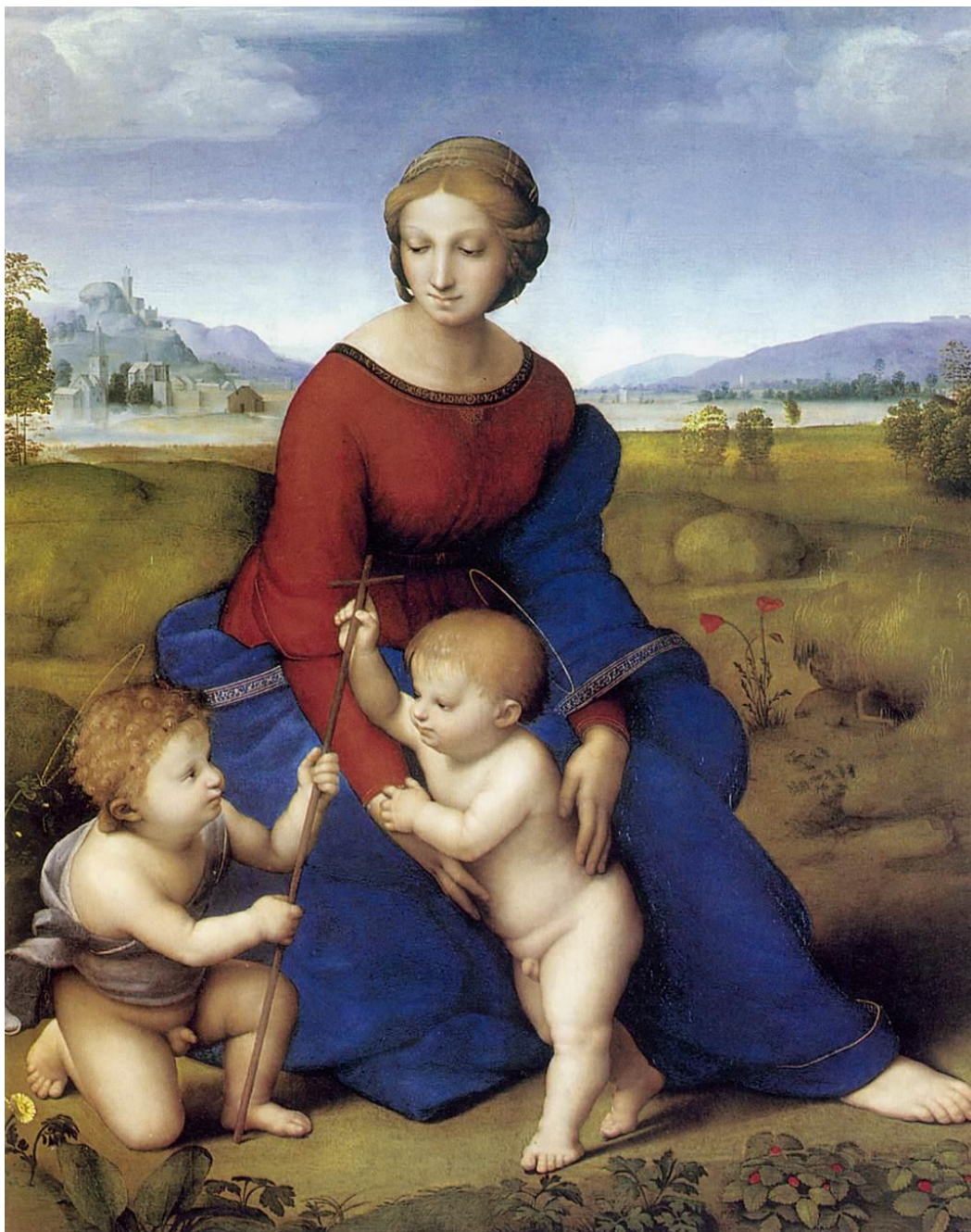
Рафаэль Санти. Мадонна в зелени. 1505-1506.

Перед вами две картины на схожий сюжет: Мадонна с младенцем и Иоанном Крестителем. Проанализируйте сходство и различия этих произведений. Порассуждайте о стиле мастеров и о живописном языке эпохи Ренессанса.